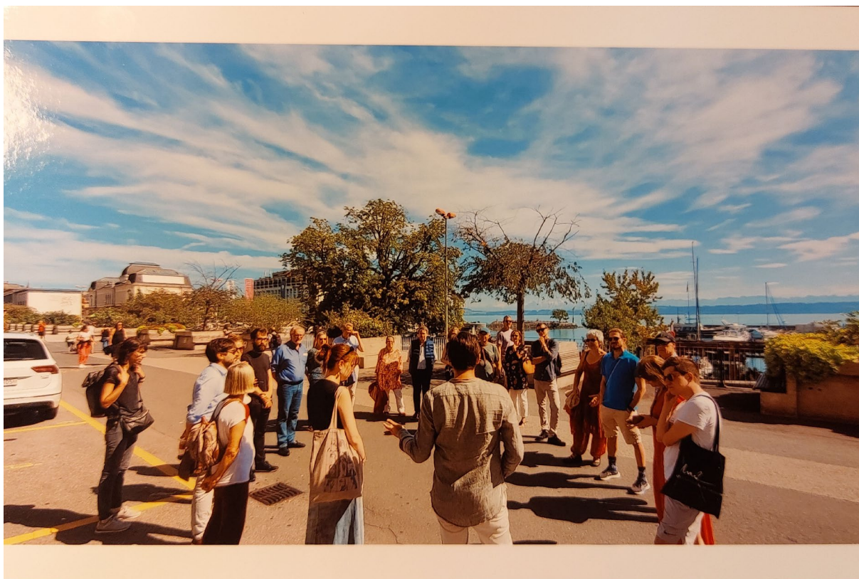
Fête d'été, 7 septembre 2024.